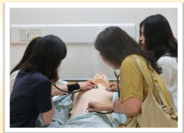
シミュレーション人形体験