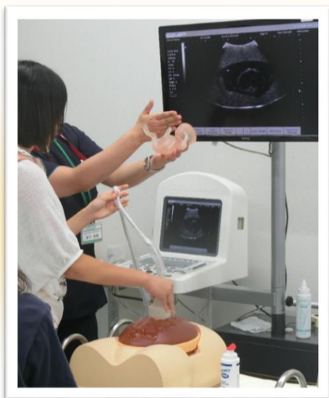
胎児ファントムを用いた エコー（超音波検査）体験