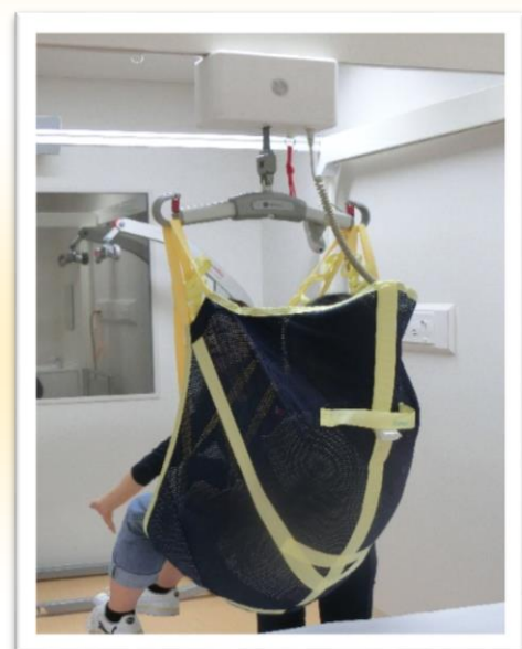
リフターの介助体験