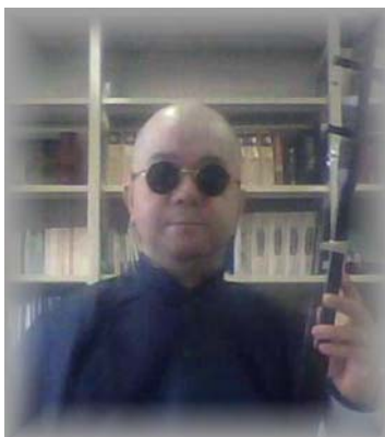
アーテン 「阿田」も再登場するかも？