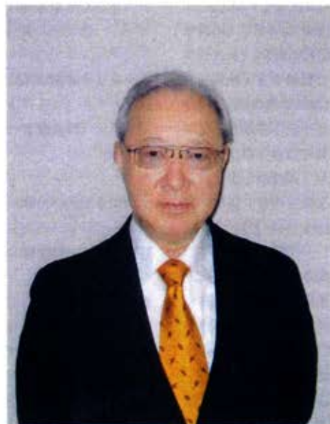
菅原 基晃 (1941-)