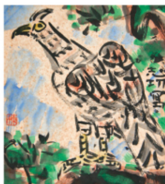
本誌創刊記念・棟方志功画