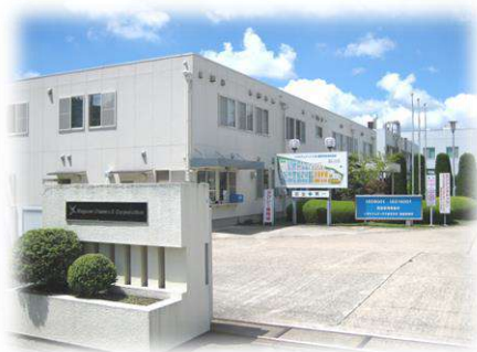
ナガセクムテックス(株)播磨事業所

午前中は、姫路獨協大学薬学部に、午後からは、ナガセクム テックス(株)播磨事業所を訪問するよ。どんなことをやっているか、見 に行ってみよう！