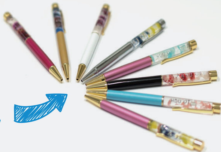
<写真はイメージです>

こうさく にがて しょうがくせい さぎょうりょうほうがっか だいがくせい 工作が苦手な小学生でも、作業療法学科の大学生がサポートします。この機会にぜひ大学に遊びに来てね。