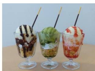
ぴあぴあパフェ 300円 ※写真はイメージです。

場 所：姫路獨協大学 学生会館1階 営業時間：平日 9:30~15:00 (大学休校日は除く) ※ランチは 11:00~(なくなり次第終了)